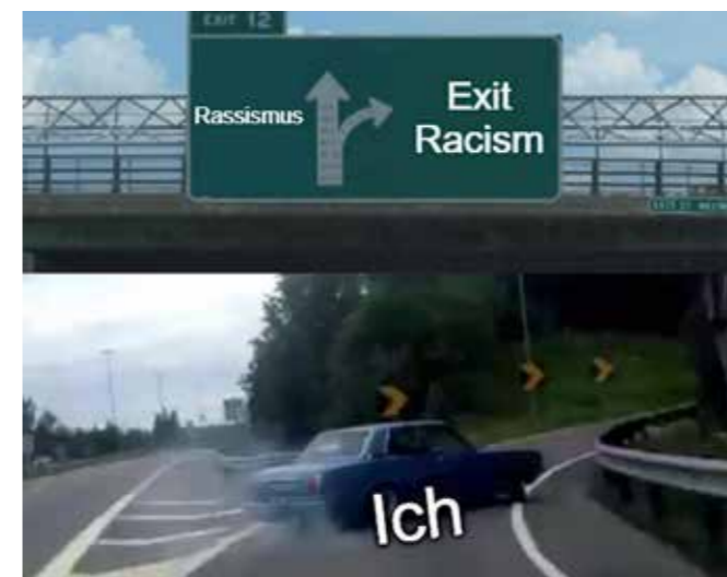
Meme einer Konfi-Gruppe zu Rassismus heute.