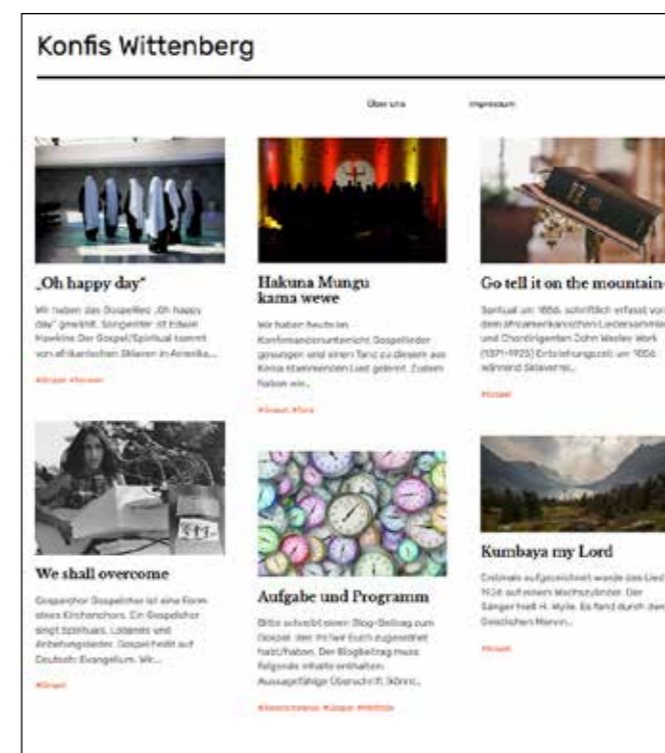
Screenshot der KonfisWittenberg-Seite.

Ganz einfach hat die Junge Akademie das bei einem Konfi-Tag mit Wittenberger Konfis erprobt. Das Thema des Tages war Gospelmusik. Am Vormittag musizierte die Gruppe selbst und am Nachmittag setzen sie sich mit den Liedern, ihren Botschaften und religiösen sowie politischen Hintergründen auseinander. Dabei entstand diese – zugegebenermaßen sehr einfache – Seite.