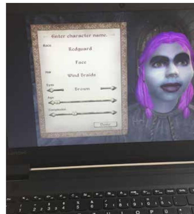
Ein Avatar, der im Fantasy-Computerspiel „Oblivion“ (Bethesda Game Studios, 2006) erstellt wurde.

4. Eigene Avatare erstellen: Die Konfis sind nun eingeladen, ihre eigenen Avatare zu erstellen und deren Geschichten zu erzählen. Dazu bietet sich an, verschiedene kreative Möglichkeiten zur Verfügung zu stellen. Avatare können z.B. gezeichnet oder als Textgeschichte verfasst werden, es können Kurzfilme mit dem Smartphone gedreht oder auch kleine Live-Theaterstücke vorgespielt werden. Für die Erstellung von Avataren am Computer bieten sich Computerspiele mit eigenem Avatar-Generator oder auch Generatoren aus dem Internet an.