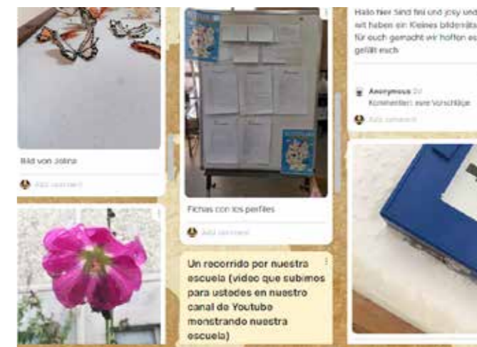
Screenshot einer Projektpinnwand des CHAT der WELTEN Mitteldeutschland

5. Diskussion mit der Partnergruppe: Nun werden alle Bilder zu Frage 2 aus dem 1. Schritt gemeinsam mit der Partnergruppe betrachtet und ggfs. einzeln ausgewertet – vorzugsweise bei einem Großgruppen-Live-Chat oder per textbasierter (asynchroner) Diskussion direkt auf der Pinnwand. Dabei sollte diskutiert werden, warum es eine Rolle spielen kann, die eigene Umgebung mit einem „fremden Blick“ zu betrachten bzw. abzubilden und warum andererseits Darstellungen häufig dann erst einen stereotypen Charakter bekommen, wenn sie von anderen betrachtet werden. Fragen wie: „Was hat Euch bei der Übung überrascht?“ oder „Inwiefern prägt meine eigene Geschichte meine Wahrnehmung und Betrachtungsweise?“, können außerdem hilfreich sein, um die Diskussion anzuregen. Falls keine Partnergruppe vorhanden ist, kann die Diskussion auch innerhalb des Plenums geführt werden.