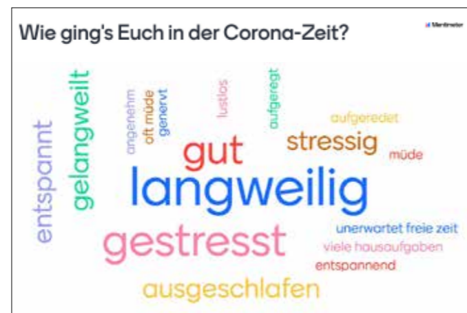
Wortwolke mit dem Tool Mentimeter