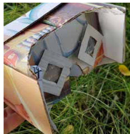
Aus einer Pizzaschachtel gebastelte VR-Brille