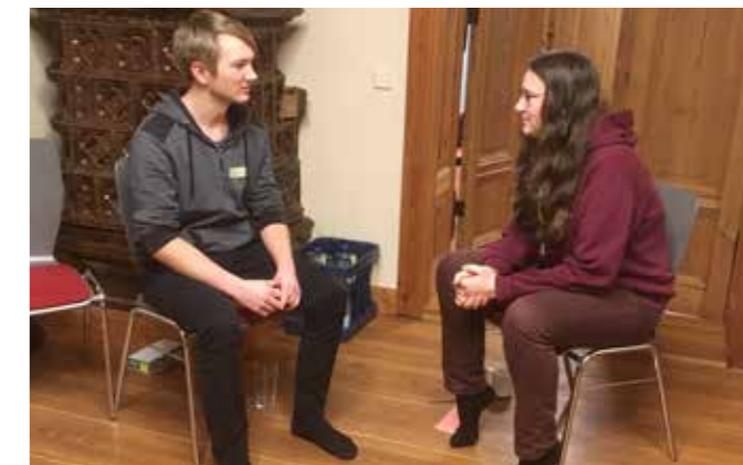
Foto eines Bubble Crasher Workshops.

Die Methodensammlung und alle dazu gehörenden Materialien sowie Praxiserfahrungen stehen online zur Verfügung: http://bubblecrasher.de/ [06.08.21].