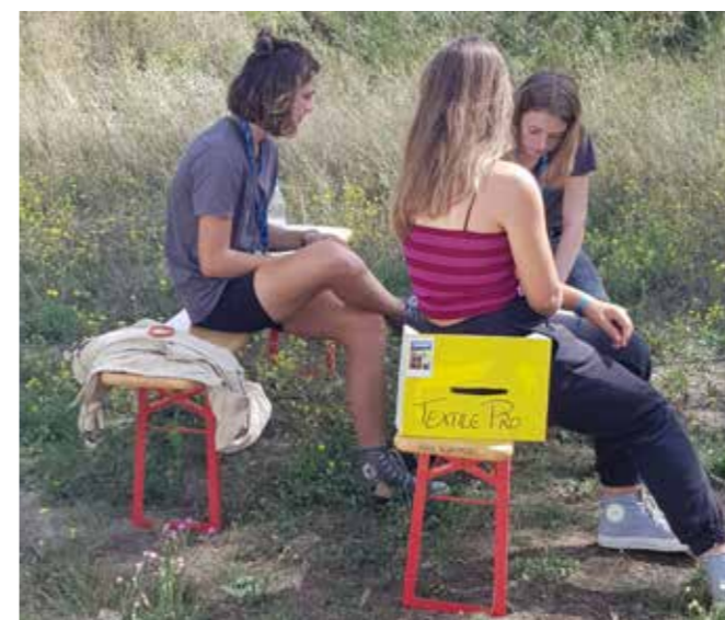
Kleingruppe im Planspiel FairKleidung auf den KonfiCamps 2019 in Wittenberg.