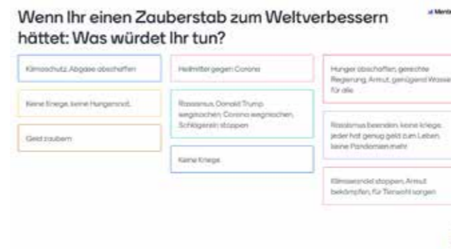
Bild einer offenen Frage mit dem Tool Mentimeter.