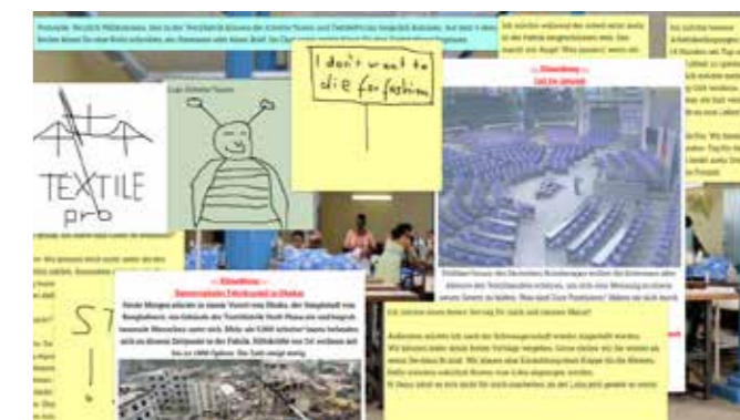
Screenshot des Raums „Textilfabrik“ auf einer virtuellen Pinnwand.

Beim Spielen online können als virtuelle Pinnwände oder Messengerdienste unterschiedliche Anbieter genutzt werden – im besten Fall Programme, mit denen die Gruppe bereits gearbeitet hat. Mögliche Beispiele sind Padlet und Pin-Up, aber auch Chaträume über Rpivotuell, Discord oder Slack sowie geteilte Dokumente wie bspw. mit Cryptpad bieten die Option eines Gruppenchats. Auch zu vielen anderen Inhalten wurden bereits Planspiele für die Konfi-Arbeit entworfen. Hierzu gehören Themen wie interreligiöser Dialog, Klimagerechtigkeit oder Flucht und Asyl. Auf einige Beispiele wird in den vertiefenden Inhalten verwiesen.