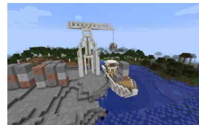
Screenshot aus dem Computerspiel MineHandy.

Für einen mehrstündigen Konfitag können weitere Elemente ergänzt werden, z.B. ein Tisch oder Raum, in dem ein Mobiltelefon auseinandergenommen wird oder Youtube-Videos und Materialien zur Wertstoffkette rund ums Smartphone zur Verfügung gestellt werden. Diese Erfahrungen können dann gegebenenfalls auch in die Artikel einfließen. Zwei Beispiel für einen solchen Ablauf finden sich online.